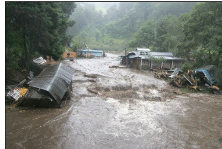
Une rue dévastée du village d'Agua Escondida

Après Mitch en octobre 98 voici maintenant Stan !