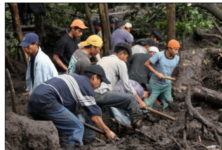
Des villageois à la recherche des corps