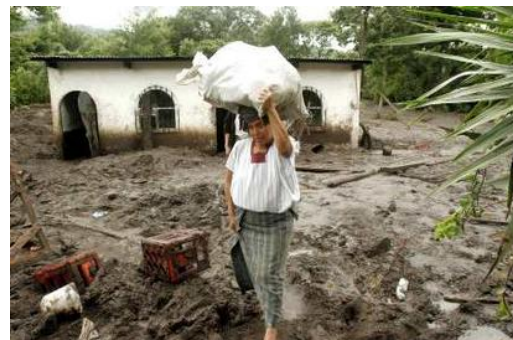
Deux habitantes de Panajab dans la boue qui a déferlé du versant du volcan San Lucas

Sur place les élèves de l'école du Gran Mirador ont manifesté leur solidarité, malgré le peu de ressources de leurs familles, en apportant de la nourriture pour les victimes de Stan.