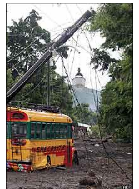
Quand les éléments se déchaînent rien ne les arrêtent